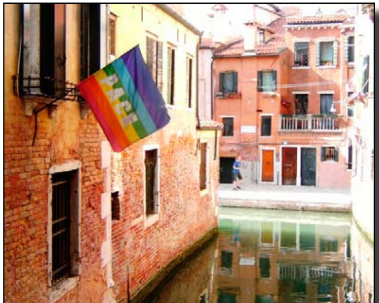
La bandiera della pace a Venezia..

Le idee di Capitini vivono ora in Servas Italia e forniscono molteplici occasioni di riflessione. Attraverso la futura diffusione di atti dei nostri convegni e materiali di studio, vorremmo diffondere un arcobaleno di pace in tutto il mondo!